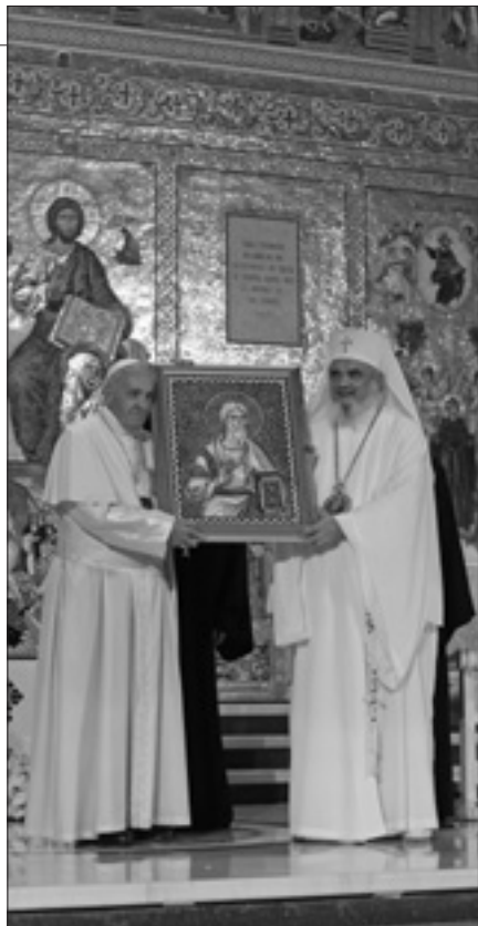
Il discorso del patriarca Daniel

Ogni giorno abbiamo bisogno di Lui, nostro pane quotidiano. Egli è il pane della vita (cfr. Gv 6, 35-48), che ci fa sentire figli amati e stama ogni nostra solitudine e orfananza. Egli è