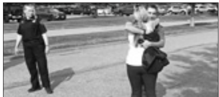
Due dei dipendenti del municipio di Virginia Beach scampati alla sparatoria

WASHINGTON, 1. Dodici persone sono state uccise in una nuova sparatoria negli Stati Uniti, mentre sarebbero almeno sei i feriti confermati. La strage, riferiscono i media locali, è avvenuta in un complesso di edifici amministrativi del municipio di Virginia Beach, cittadina turistica nello stato della Virginia. A sparare è stato un ingegnere di 40 anni poi ucciso durante un conflitto a fuoco con la polizia. L'uomo, che lavorava nel dipartimento dei servizi pubblici della città ed era stato da poco licenziato, nel pomeriggio di ieri è entrato negli uffici e ha aperto il fuoco colpendo in modo indiscriminato i dipendenti. Nell'attentato, rende noto la polizia, è stato colpito anche un poliziotto, salvato dal giubbotto antiproiettile. Sul luogo della sparatoria, dove gli investigatori hanno trovato una pistola semiautomatica e un fucile, entrambi utilizzati per compiere la strage, è arrivata anche l'Fbi.