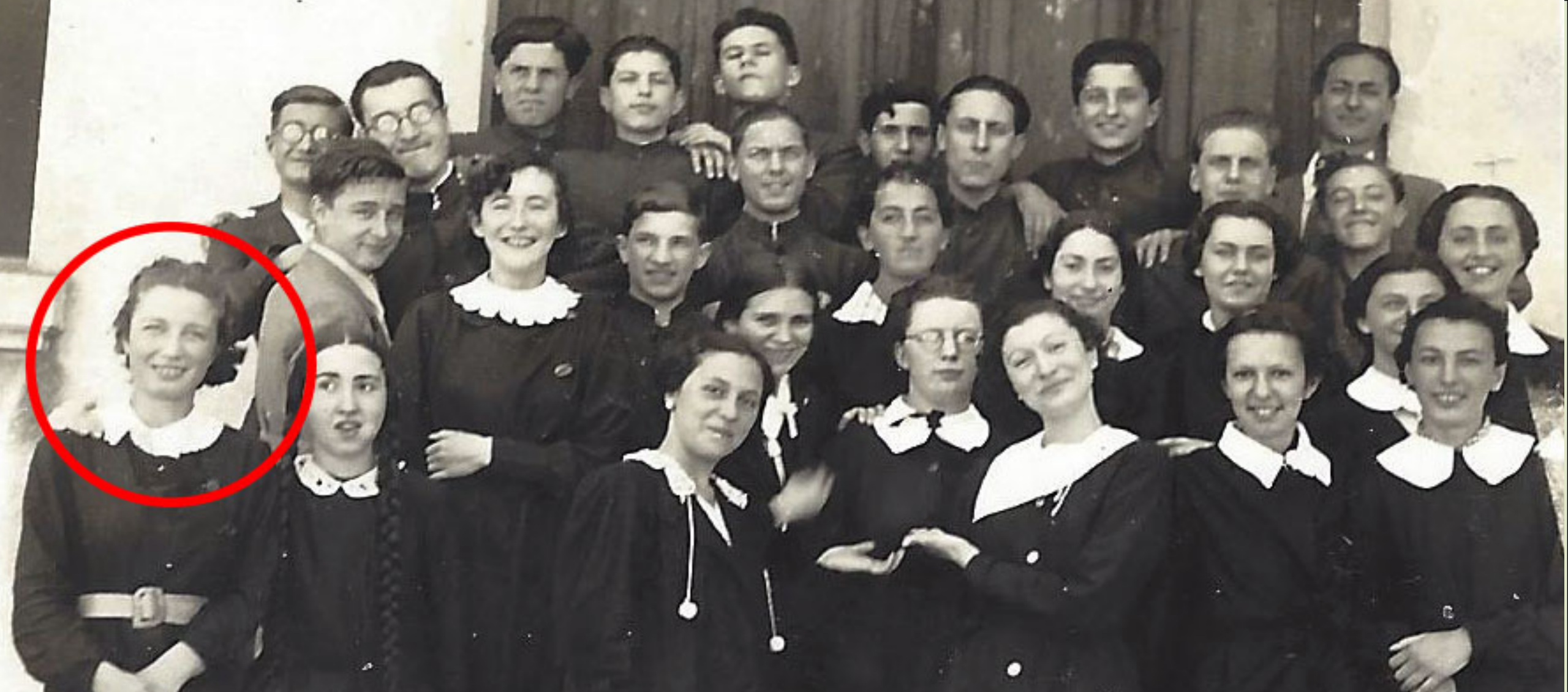
A Udine ha frequentato lo storico liceo Stellini, durante gli anni del regime